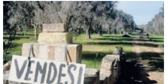
La vendita dei terreni non redditizi è una delle cause del ritorno dei latifondi

che da Usa, Corea del Sud e altri. La causa scatenante di questa nuova forma di pseudo colonizzazione economica è la crisi dei prezzi del 2007 e anni successivi. Ciò ha spinto alcuni paesi a prendere possesso a vario titolo di aree coltivabili in altre nazioni, per assicurare alla propria popolazione il rifornimento alimentare. Secondo una stima della Banca Mondiale, il fenomeno riguardava nel 2010 circa 50 milioni di ettari, ma si ritiene che le cifre reali siano molto superiori. Una ricerca di International Land Coalition rivela che attualmente nel mondo l'1% dei proprietari terrieri controlla e gestisce il 70% dei terreni coltivabili. Questa forte tendenza alla concentrazione deriva dall'urbanizzazione di ampie fasce delle popolazioni rurali avvenuta dagli anni '80 dello scorso secolo, dovuta alla scarsa remuneratività offerta soprattutto dalle piccole proprietà rurali e dalla difficoltà di accedere al credito da parte dei piccoli agricoltori. Tutto questo ha una forte ricaduta economica e sociale. Basti pensare al fenomeno delle migrazioni