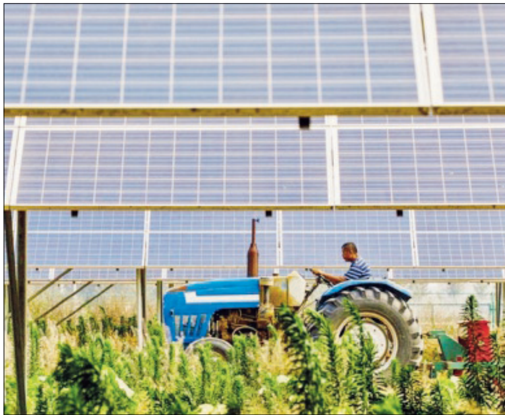
Un impianto agrivoltaico (foto d'archivio)

Un ruolo non secondario, poi, lo gioca anche la crescente inflazione, che ha aumentato i costi di produzione sia del greggio che dei trasporti. La guerra russo-ucraina dell'ultimo mese e le molteplici conseguenze economiche e politiche, tra cui la decisione di introdurre sanzioni al petrolio russo, ha infine dato un'ulteriore accelerata alle quotazioni del greggio. I Paesi europei stanno cercando di reagire. L'Italia già nel 2020 aveva lanciato il noto "Superbonus 110%" destinato all'efficienza energetica degli edifici. Più recentemente è stato annunciato il cosiddetto "Decreto bollette", volto a frenare i rincari e a rilanciare la produzione di energia rinnovabile, in particolare l'elettricità prodotta da fonti alternative. Per quanto riguarda il settore agricolo, il ministro Stefano Patuanelli